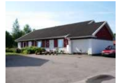
(4) I Fagerreds samhälle finns hyreslägenheter i ett lugnt och fridfullt område.