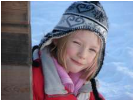
Tacka velt jag ett barnvänligt samhälle.