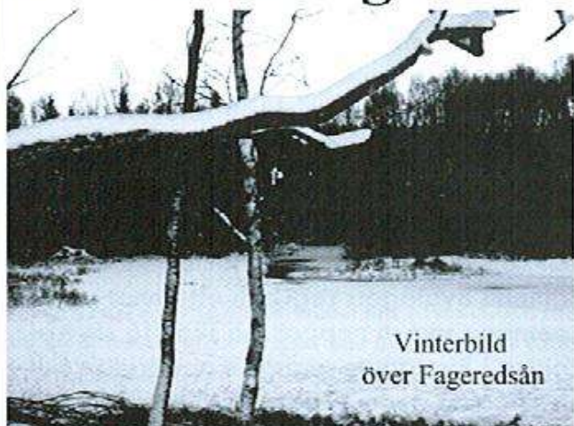
Vinterbild över Fageredsån

Välkomna till ytterligare ett sockenblad och ett nytt år med Fagereds byalag. År 2006 har börjat med en rejäl vinter till mångas glädje eller förfäran. Men hur man än känner inför vintern och snön så hoppas vi att ni får en skön stund med en intressant läsning och att ni bokar in arrangemangen som finns på sista sidan i er almanacka eller klipper ut och sätter på kylskåpet så att ni inte missar något av bygdens arrangemang. Vi har en aktiv bygd med många fina föreningar som anordnar mycket i vår bygd vilket vi skall vara stolta över. Allt har vi inte fått in för att kunna marknadsföra på vår arrangemangslista så håll även ögonen på anslagstavlan vid affären i Fagered och anslagstavlan vid Kvartermästargården i Lia så kommer det säkert fler arrangemang. För den som kan koppla in sig på nätet, kan gärna ta en titt på Fagereds hemsida www.fagered.com eller Ullaredsbygdens pärlors hemsida www.ullaredsparlor.se För här finns mer information om vår bygds arrangemang och även bygderna runt om kring oss.